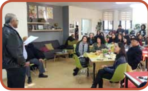
اجتماع هيئة تدريسية