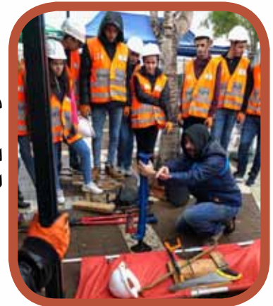
دورة "الإتقان" لطلاب العاشر