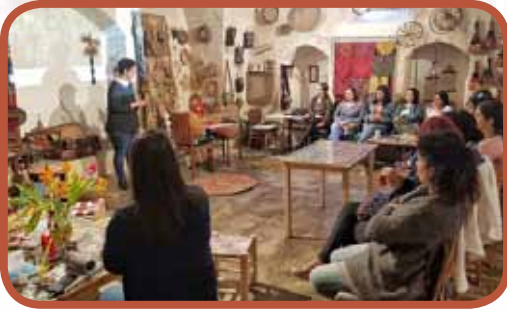
لقاء للمعلمين في "زاوية غادة"