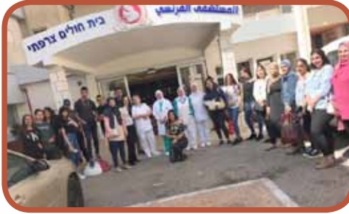
زيارة للمستشفى الفرنسي