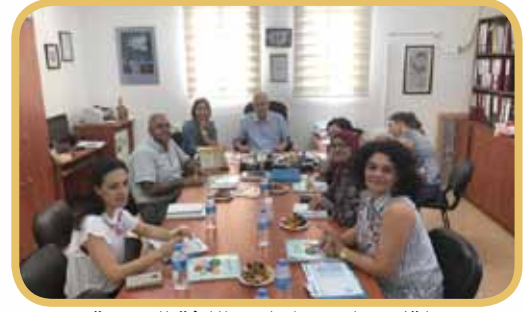
لقاء تعليمي لمعلمي اللغة العبرية