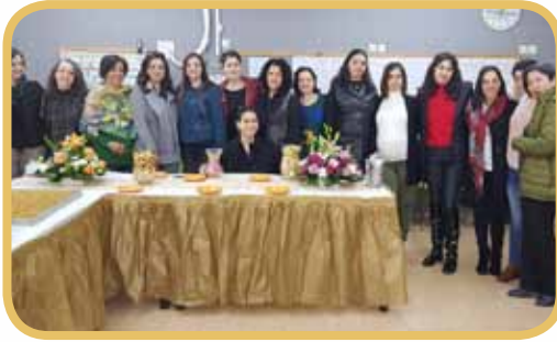
احتفالات يوم المرأة