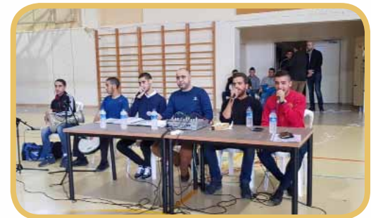
الاحتفال بذكرى المولد النبوي الشريف