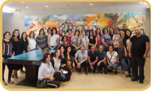
زيارة المعلمين لمتحف ياسر عرفات