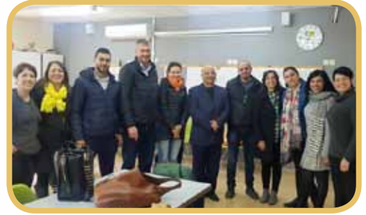
لقاء حنين ومحبة واحترام