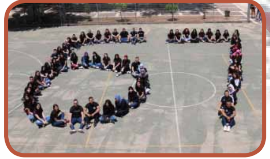
صورة الفوج 67