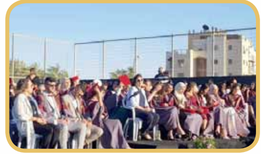
حفل تخرّج الفوج 66