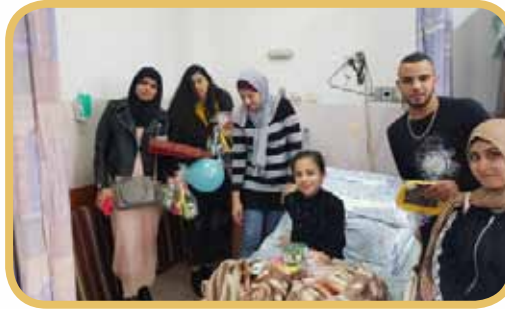
زيارة لمستشفى المقاصد في القدس