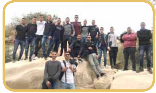
رحلة المبيت لصفوف الثانية عشر