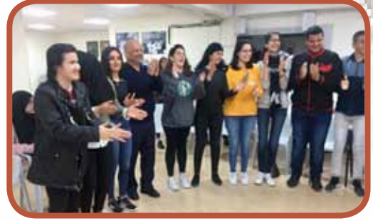
يوم موسيقى شرقية ودبكة فلسطينية