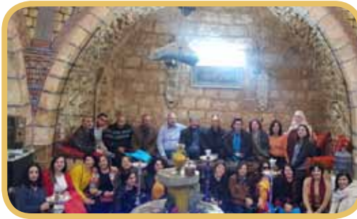
زيارة المعلمين لمدينة نابلس