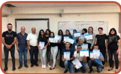
الاحتفال باختتام دورة " الادارة المالية والتسويق "