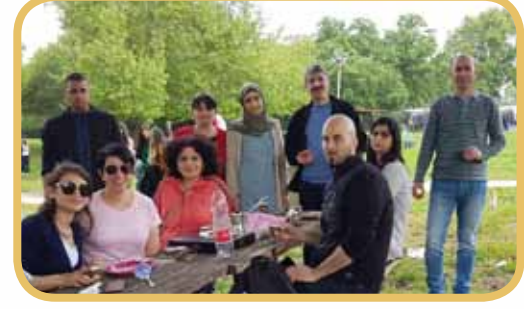
رحلة الوداع لصفوف الثانية عشرة - منتزه تل القاضي