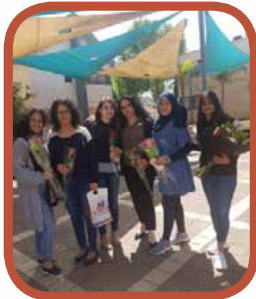
احتفالات يوم الأم