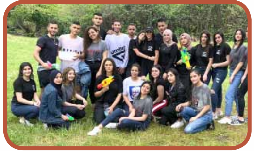
رحلة الوداع لصفوف الثانية عشرة - منتزه تل القاضي