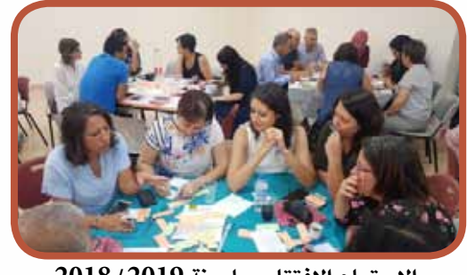
الاجتماع الافتتاحي لسنة 2018/2019