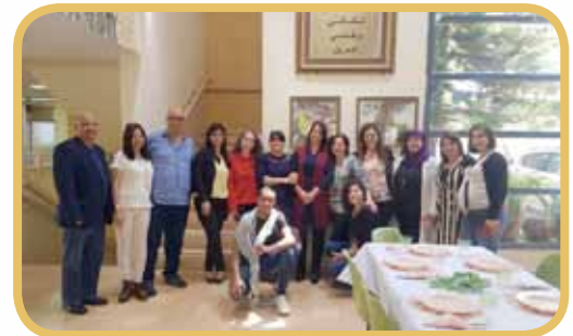
في رحاب المدرسة