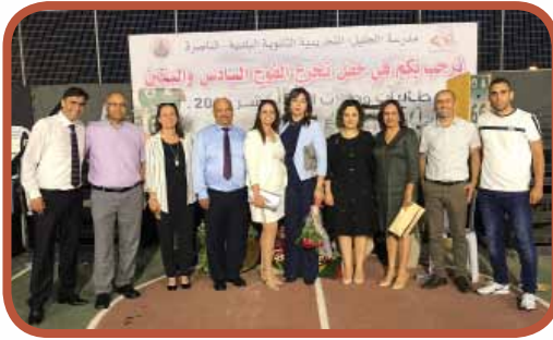
حفل تخرج الفوج 66