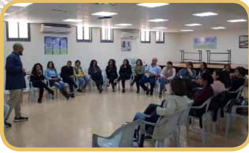
ورشة عمل للمربين بموضوع الجنسانية