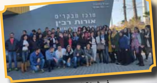
في شركة الكهرباء