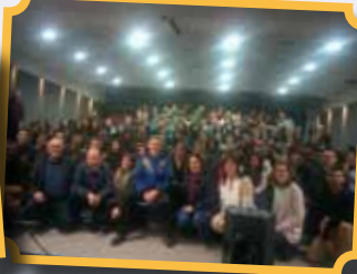
لقاء مع رائد فضاء