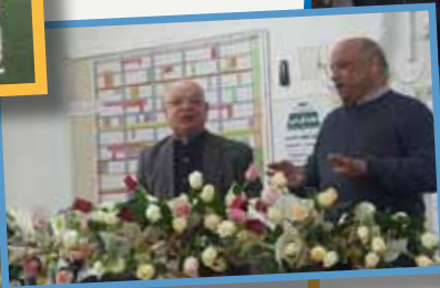
احتفالات يوم المرأة