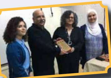
لقاء مع النائبة عايدة توما