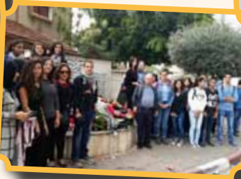
إحياء ذكرى مجزرة كفر قاسم