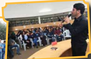
لقاء مع الشاعر مروان مخول