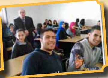
لقاء مع الكاتب سيمون عيلوطي