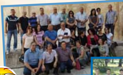
رحلة المعلمين الى رام الله