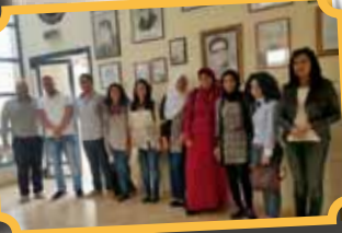
تواصل مع الخريجين