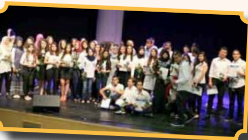
طلابنا في حفل تكريم المتفوقين