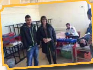
يوم التبرع بالدم