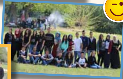
في رحلة الوداع