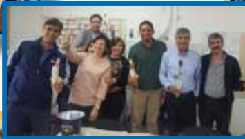
احتفالات يوم المرأة