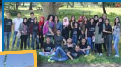
يا عيني عليكم طلابنا الاحباء