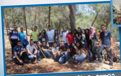
اختتام فعاليات "جسور وتواصل"