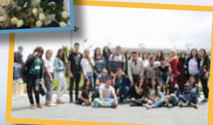
يوم اللغة العربية في الكنيست