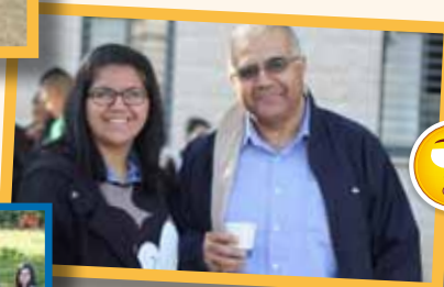
وكبرنا يا ببي