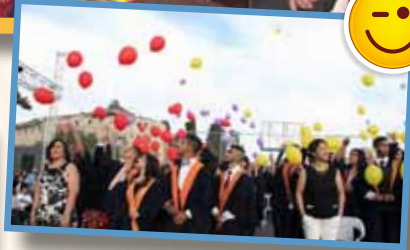
تخرج الفوج الـ 63