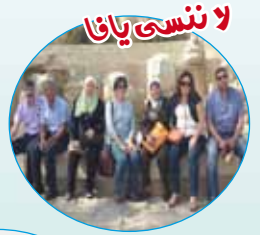
لا ننسى يانا