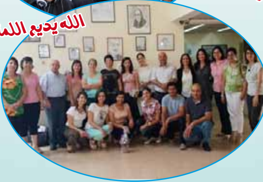
الله يدعي اللمة