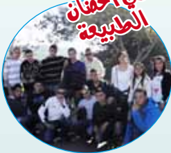
في أحضان الطبيعة