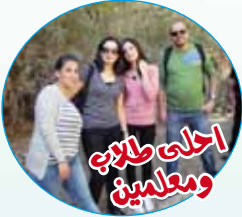
احلى طلاب ومعلمين