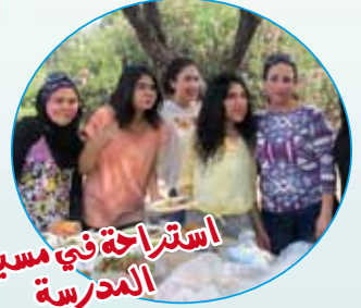
استراحة في مسيرة المدرسة