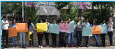
طلاب العاشر " هـ " في مظاهرة رفع شعارات