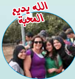
الله يديع المحبة