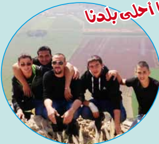
ما أحلى بلدنا