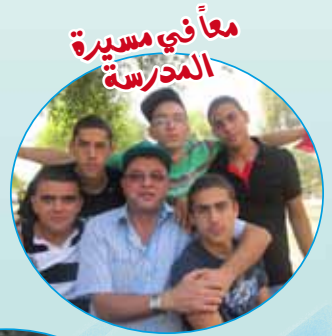
معاً في مسيرة المدرسة