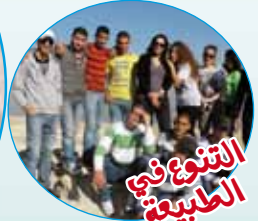
التنوع في الطبيعة