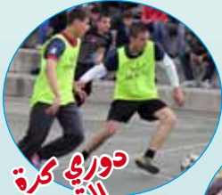
دوري كرة التقدم