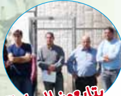
يتابعون المباراة بتشوق